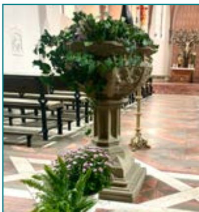
Taufstein von Edith Stein

gelegenen Bad Bergzabern. Es war der 12. Oktober und das ist der Geburtstag von Edith Stein. Die Heilige wurde 1922 in dieser Kirche getauft und sie ist die Namenspatronin der Pfarrei, die ihr an diesem Tag gedachte. Der Taufstein war festlich geschmückt. Er ist in der Mitte der Kirche positioniert unter einer Statue der Heiligen als Sr. Teresia Benedicta a Cruce im Ordensgewand.