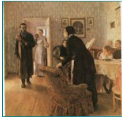
Ilja Repin: "Sie erwarteten ihn nicht mehr", ca. 1886

= ausländisch) gekleidet war und unter seinen Nachfolgern/-innen waren die meisten mit deutschen Ehepartnern/-innen verheiratet. Nur seine Tochter Elisabeth (1741-62) hatte einen russischen Ehemann. Unter ihrer Regierung gründete Lomonossow, der in Marburg studiert hatte, 1755 in Moskau die erste russische Universität. Ihrer Nachfolgerin Katharina II. (1762-96) gelangen Vorstöße in Richtung Süden und Westen, die mit der Teilung Polens endeten, an der auch Preußen und Österreich beteiligt waren. 1825 versuchten Offiziere nach französischem Vorbild demokratische Werte einzuführen. Diese Bewegung der "Dekabristen" wurde niedergeschlagen, ihre Teilnehmer nach Sibirien verbannt. Das Bild von Repin zeigt einen Verbannten, der nach 20 oder mehr Jahren wieder nach Hause kommt, von der Familie eher nicht mehr erwünscht. Auch später war die Verbannung eine verbreitete Strafe. Die Staaten, die sich gegen Napoleon durchgesetzt hatten, schlossen sich in der "Heiligen