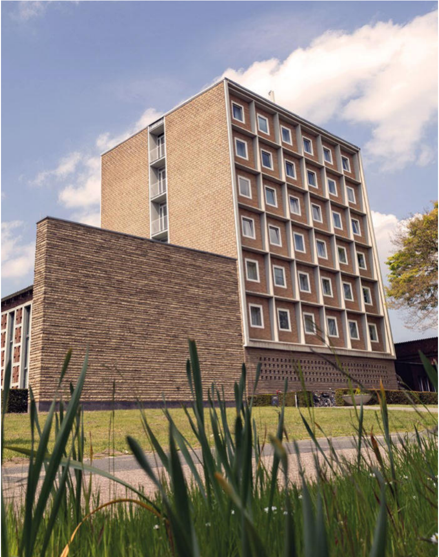
Katholisch-soziale Akademie Franz Hitze Haus